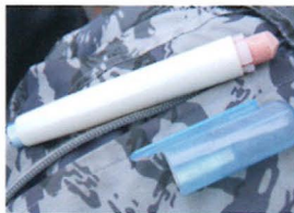
①チョーク 積み荷を店別に仕分ける為に使います