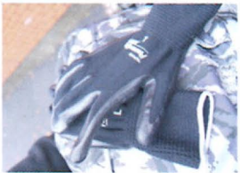
③軍手 荷物を運ぶのに軍手は必須です