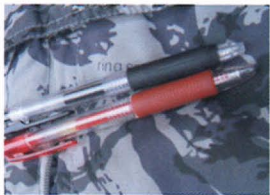
②ボールペン メモしたり、サインしたりetc...